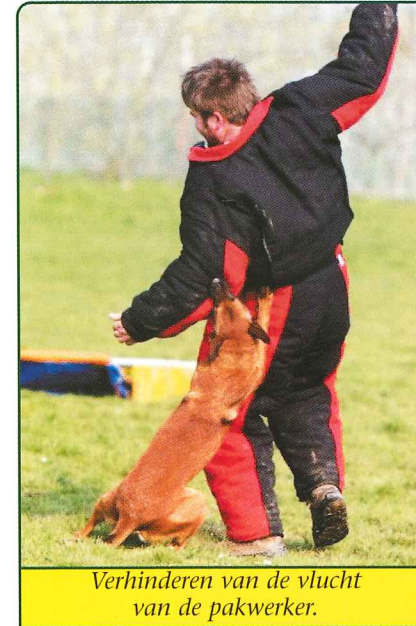
Verhinderen van de vlucht van de pakwerker.

Wanneer men als hondengeleider het programma niet meer onthouden heeft of andere te voorkomen fouten maakt bij het voorbrengen, worden er zogenaamde allurepunten afgetrokken, die net zoveel waard zijn als wanneer de hond een fout maakt. Het is dus belangrijk zich als hondengeleider zeer goed te concentreren.