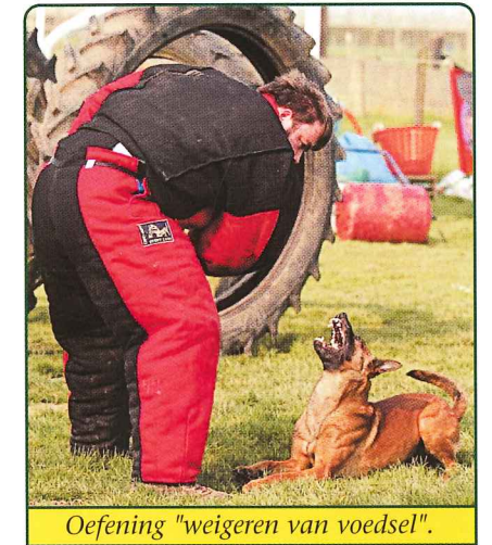
Oefening "weigeren van voedsel".

Mondioring: een toffe sport die veel eist van hond en geleider en terecht aandacht in de hondensportwereld